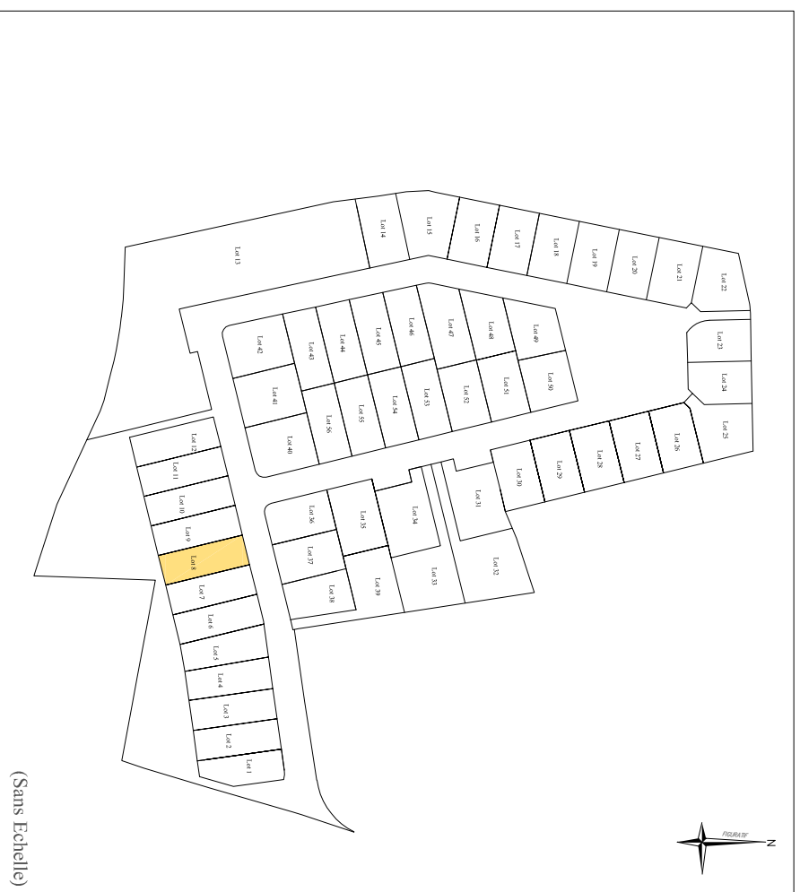
PLAN DE COMPOSITION

Si : Superficie indicative selon PA n° 013 039 21 G 0007